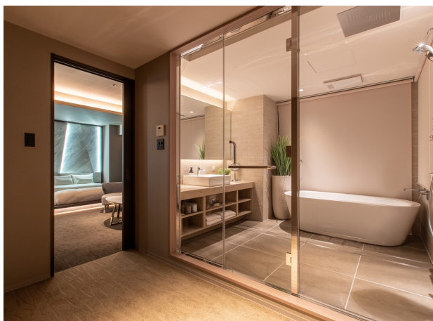
ロイヤルスイート