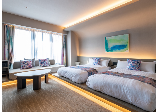
ヘラルボニー スーパーアツイン