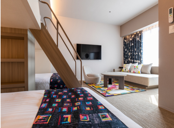
ヘラルボニー スタンダードバンク

「FAV HOTEL 広島スタジアム」に続き、福祉実験ユニット「ヘラルボニー」とのコラボレーションが実現いたしました。同社は「異彩を、放て。」をミッションに、知的障害のある作家の作品を自社ブランドやライセンスに活用し、社会の障害に対するイメージのアップデートに挑む会社です。今回も共用部と客室に「ヘラルボニー」が契約するアーティストのアート作品を12点展示し、ホテルを彩りました。展示した客室はスタンダードバンク、スーパーアツインの2タイプあり、部屋によってさまざまな表情のアートを楽しむことができます。