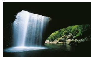
ゴールド・コースト