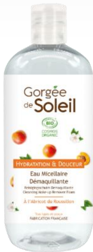
ミセラークレンジング ウオーター