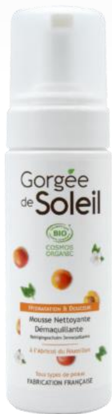
クレンジングフォーム