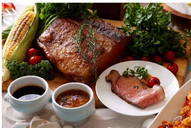
アンガス牛のロースト インダイレクトロティー

ご用意いたします。神奈川県産の恵壽卵のkokがたまらないプリンや季節のフルーツを盛り込んだ、体にも優しい目福口福のスイーツも厳選して食後にご用意いたします。