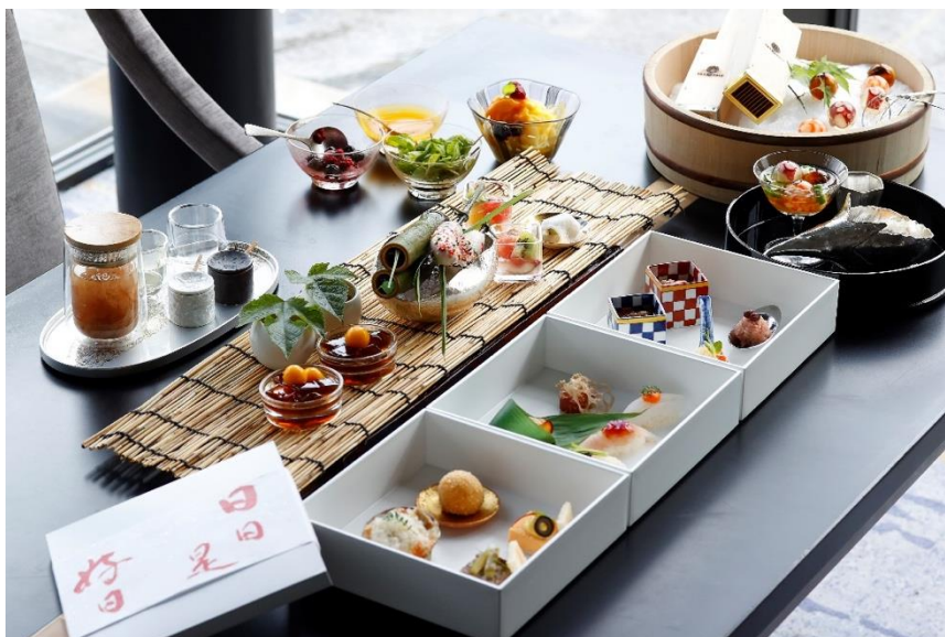
新・濱茶膳～夏祭り～

「夏のキャンペーン」第2弾では、「夏祭り」をテーマにしたレストランメニューが新登場。