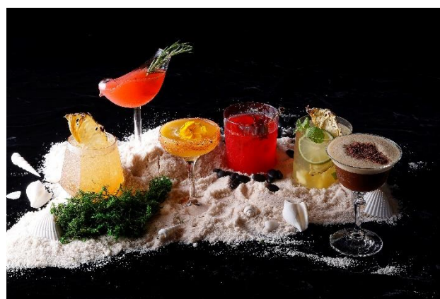
THE KAHALA Signature Cocktail -Nature of Hawaii-

ザ・カハララウンジからは「Nature of Hawaii」をテーマにしたシグネチャーカクテルも登場。雄大な自然とともに育まれるアロハ精神。美しい文化は、自然の中に見出した神々を愛し、自然を守り暮らしてきた先住民によって伝えられてきた。今回、ハワイの自然の息吹をまとったカクテルが新登場。五感を通してハワイを感じられるサービスと共に、ハワイをお楽しみください。