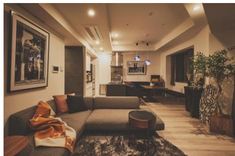
村野担当のコーディネート事例