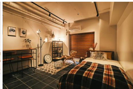
與世田担当のコーディネート事例