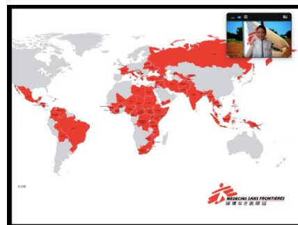
オンライン教室イメージ

本プログラムの開始にあたり、MSF 日本会長の久留宮隆は、「世界とのつながりや自他の尊重を意識し始める 10～12 歳という多感な時期に、『世界といのちの教室』を通じて視野を広げ、遠い国の人びとの命も身近な人びとの命も何ら変わらないことを感じてもらいたい。将来にわたって人道問題への関心と、人道主義に理解のある世代を育てていきたい」と述べています。