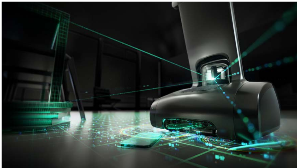
ROBOXナビゲーション技術

モビリティ ：16の異なるセンサーを使った ROBOXナビゲーションテクノロジーにて、スムーズな自律走行を実現。リアルタイムなオブジェクトや顔の認識、障害物回避、地図生成により、ユーザ追従（フォロー）やオンデマンドでの地点登録、自動運転によるナビゲーションや案内ができます。