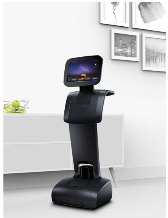
temi - The Personal Robot

さらに、temi にはソフトウェア開発キット (SDK) が用意されており、サードパーティのアプリ開発者が temi の豊富な機能を活用した、接客、教育、医療、ゲーム、セキュリティ、娯楽などの、独自のアプリケーションを作成することができます。