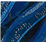
第2回 J. シュトラウスⅡ世作曲 美しく青きドナウより