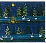
第5回 チャイコフスキー作曲 白鳥の湖より

情熱的な赤をベースに、女性のフラメンコダンサーと闘牛士が音楽に合わせて踊ります。