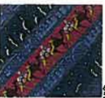
第6回 リムスキー＝コルサコフ作曲 シェヘラザードより

深い森の奥の湖に暮らす白鳥たち。月明かりに照らされ神秘的な静けさをたたえています。