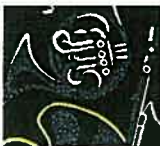
第1回 ガーシュウィン作曲 ラプソディ・イン・ブルーより