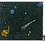
第9回 ホルスト作曲 惑星より

ベートーベンが愛した田舎暮らし。さわやかかつ広大な田園風景を空と山と大地によるストライプで表現。