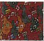
第4回 ビゼー作曲 カルメンより

鳩が届ける手紙には二人の愛を祝福するメッセージがしたためられているのでしょうか。