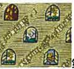
第7回 ヴィヴァルディ作曲 四季より

「千夜一夜物語」の幻想的な世界を月夜に浮かぶ寺院やラクダの隊列を用いてストライプで表現。