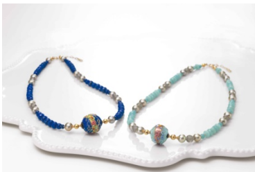
<インドラ マン スヌワール>

トンボ玉ネックレス／フィオーレヴェッテビーズ[当社限定モデル] :105,000 円(税込)