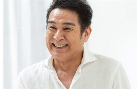
宇梶 剛士 UKAJI TAKASHI

“明日の自分が楽しみになる。”そんな気持ちにさせてくれるのがエレクトサフットだと思います。』