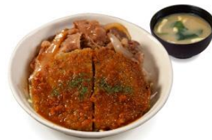
焼かつコンボ牛めし 650 円 ライス大盛 710 円