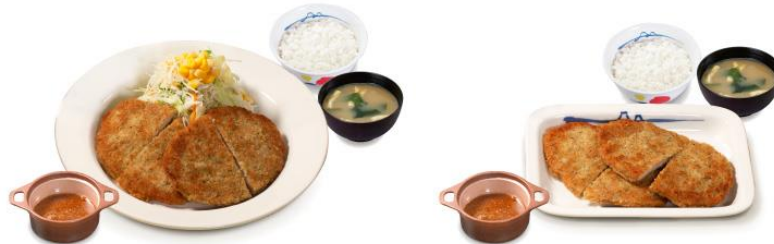
焼かつ定食 790 円