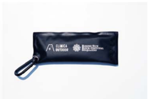
「CLINICA OUTDOOR GEAR」