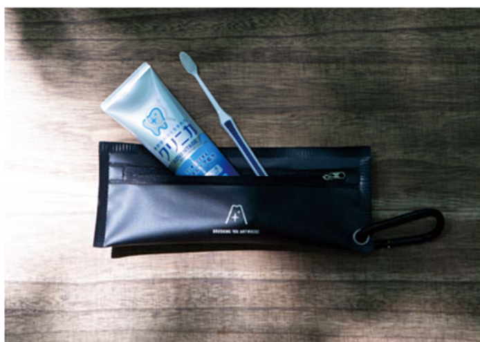
「CLINICA OUTDOOR GEAR」 ※ハミガキ・ハブラシは含まれません

ライオン株式会社(東京都墨田区)のクリニカは、リフレッシュするために訪れた旅先や屋外での歯みがきを促進するプロジェクト「CLINICA OUTDOOR」をオールナイト野外ロックフェスティバル「RISING SUN ROCK FESTIVAL 2019 in EZO」(2019年8月16日(金)～18日(日)石狩湾新港樽川埠頭横 野外特設ステージ)にて、実験的に実施いたします。カラビナでリュックやサコッシュに取り付けられる、アウトドア用ハミガキケースの「CLINICA OUTDOOR GEAR」を、キャンペーン参加者を対象に限定配布いたします。