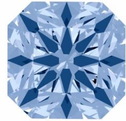
コンパス オブ ライト™

「フォーエバーマーク ブラックレーベル コレクション」は、デビアスグループが 20 年をかけて研究した結果生まれた独自のカットです。特長は「完璧なシンメトリー」による強くまばゆい輝き。これにより、これまでラウンドのみに可能だった強い輝きをファンシーシェイプにも実現しました。全てのブラックレーベル ダイヤモンドに現れる「コンパス オブ ライト™」(シンメトリーな矢模様)がその無二の輝きの証です。