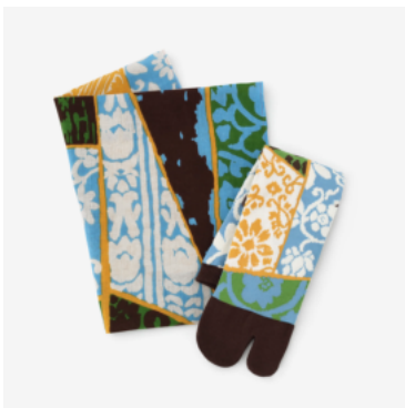
男性セット12ヶ月分 ¥21,384(税込)