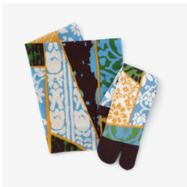
女性セット12ヶ月分 ¥21,384(税込)