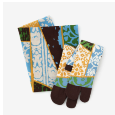
男・女セット12ヶ月分 ¥28,644(税込)