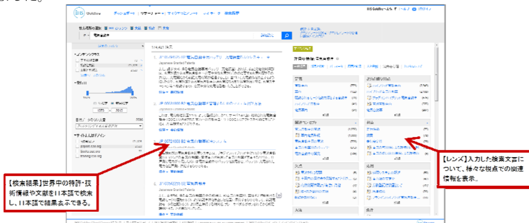
新しくなった GUI 画面 検索結果と「レンズ」による分類が一画面で網羅できる

また、長年にわたるご要望にお応えし、Goldfireの機能の中で利用頻度が最も高いリサーチ機能に特化した機能限定版「Goldfire Connect（ゴールドファイア コネクト）」もリリースされ、よりリーズナブルにご利用いただけるようになりました。