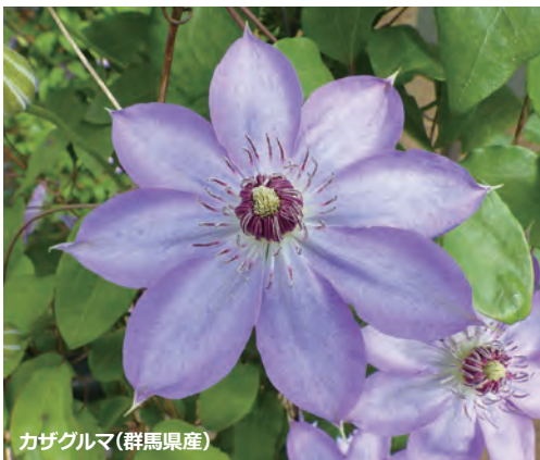
カザグルマ(群馬県産)