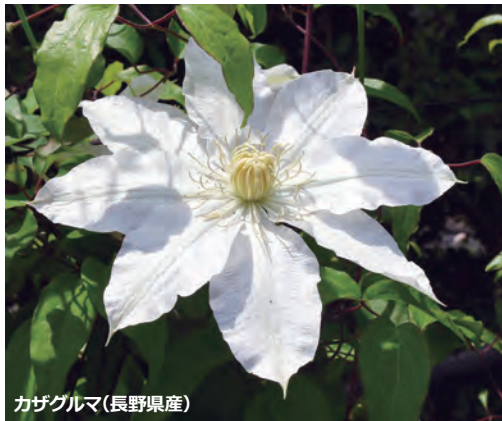
カザグルマ(長野県産)