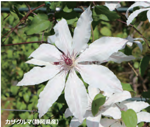
カザグルマ(静岡県産)