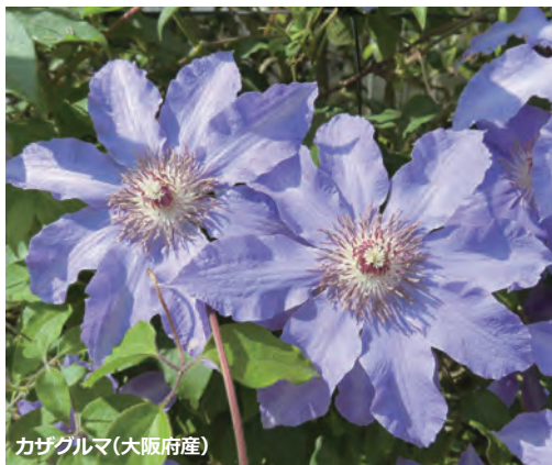
カザグルマ(大阪府産)