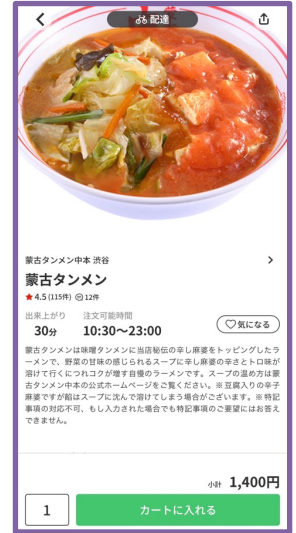
スクリーンショット例