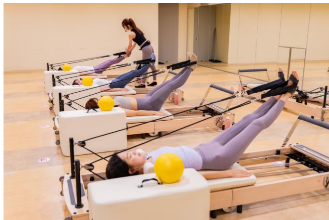
Pilates Refine のレッスンイメージ