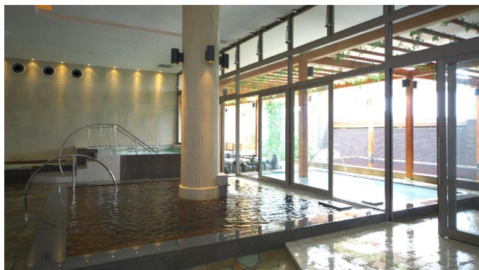
源泉掛け流し温泉