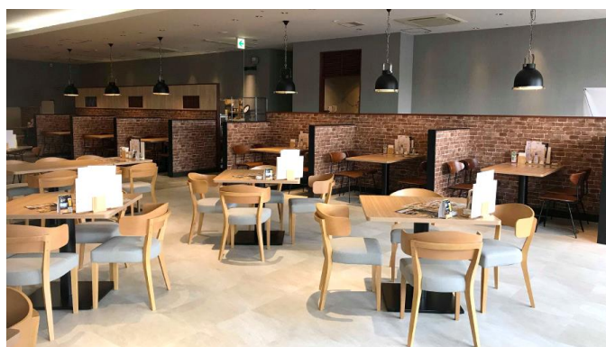
レストラン「ごはん処 お和んや」