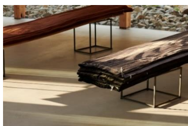
突板(安多化粧合板)