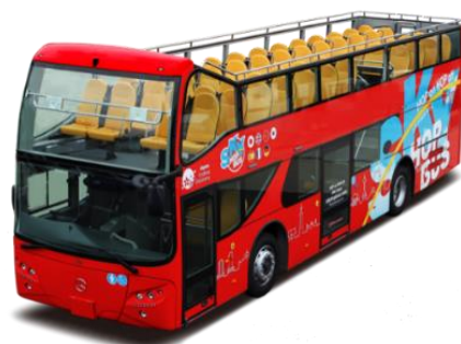
2階建てオープンバス「スカイバス」

日本初の2階建てオープントップバスツアーとして2004年に東京で運行開始。360度の景色を楽しめる開放感溢れる座席からの眺望が特徴です。バスに乗車しながら、普段とは違う視点からの景色、ダイレクトに伝わる風や音、そして香りと正に五感をフル活用させながら、バスアテンダントの楽しい案内とともに街を巡ります。また、最近ではプロスポーツの優勝パレードなどで使用されることもあります。