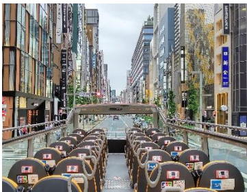
オープンバスでの換気

2階建てオープンバス「スカイバス東京」は屋根や窓のない解放感ある車両構造が特徴のバスです。スカイバス東京ではお客様に安全に楽しくご利用いただくため、各種感染予防対策に取り組んでおります。ご乗車のお客様におかれましては下記取り組みへのご理解ご協力をお願い申し上げます。