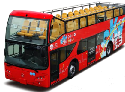
2階建てオープンバス「スカイバス」