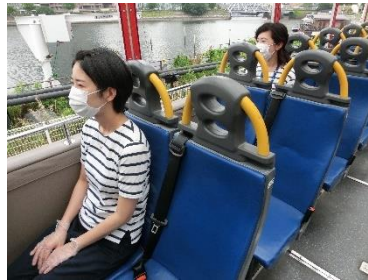
バス車内での相席の配慮