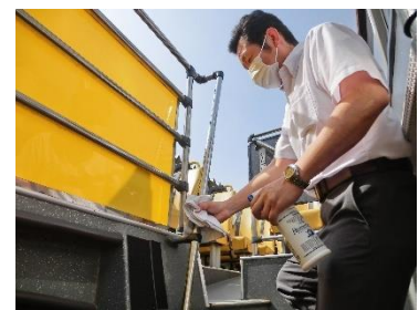
各便入れ替え時車内消毒