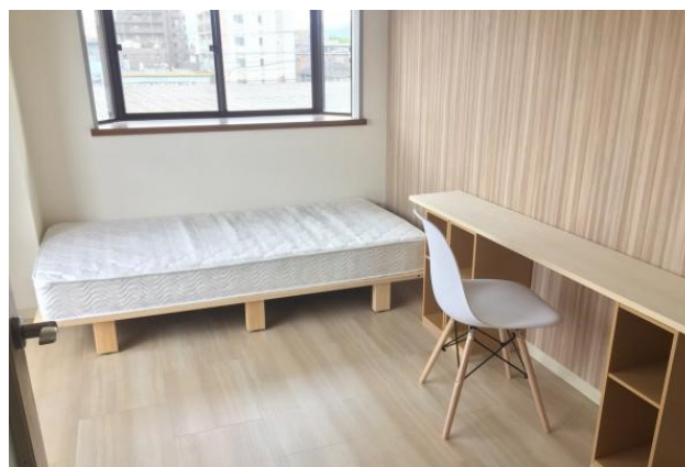
■ 物件イメージ（内観）

2019年3月の経済産業省の調査データ ※1 によると、日本のIT人材供給は、最大約79万人不足と言われております。この問題に対し当社は、2012年4月から、未経験者に対しエンジニア育成・就職を無料で支援するプログラミングスクール「プログラマカレッジ」を開始し、現在では年間600名以上 ※2 のIT人材を輩出しています。しかし、当スクールは都内で展開しているため、現状、通学可能な都内近郊在住者のみの支援に留まっていました。そこで、さらなるIT人材増加を目指すため、地方の人材育成・就職支援が不可欠だと考え、地方在住者向け支援サービスの展開に至りました。