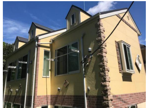
■ 物件イメージ（外観）