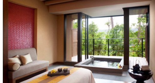
トリートメントルーム（イメージ）

同スパは、ザ・リッツ・カールトン沖縄のホテル棟とは別棟となる独立した2階建てで、沖縄本島北部“やんばる”の豊かな緑に囲まれたロケーションに建ち、トリートメントのみならずヒートエクスペリエンス（温浴施設）やリラクゼーションルーム、ネイルサロン、屋内プールエリアにはジェットバスやデイベッド、また、24時間利用可能なフィットネスジムも備え、トータルなリラクゼーションをゲストの皆様に提供いたします。