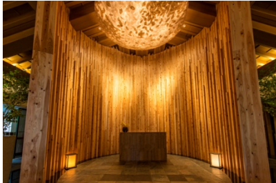
スパレセプション