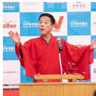
(※左から「海老の水槽展示」、「海老の解剖教室」、「海老落語」の様子)