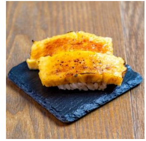
奥久慈玉子のブリュレ握り