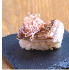
ふあふあ真鯛の握り

変わり寿司 299円 (税込 329円) * 温故知新、自由な発想で生まれた楽しくおいしい進化スシ ふあふあ真鯛の握り 出汁じゅわすぎな稲荷 生オイルサーディン握り バカとろ炙り のどぐろ昆布炙り 凄いコーンマヨ軍艦 (2貫) 貝割昆布炙り (2貫) 奥久慈玉子のブリュレ握り (2貫)