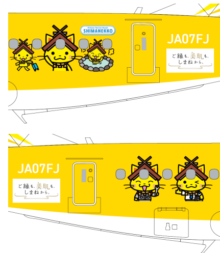
イラスト拡大 (上:左側面 下:右側面)