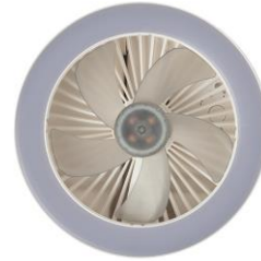
メタックスカーボンセラミックをコーティング

ファン、LEDカバーには、ファイテンの水溶化メタル技術「メタックス」を採用した素材「メタックスカーボンセラミック」をコーティング。 LEDから照射される光にファイテンの技術をプラスした「健光浴®」の光でリラックスをサポートし、カラダの不調や肌トラブルにアプローチします。