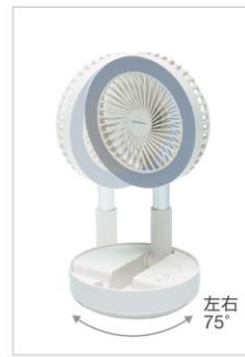
左右自動首振り機能

左右 75 度の自動首振り機能に加え、角度・高さ調節が可能。 お好きな場所に風を拡散させ、効率的に涼をとることができます。