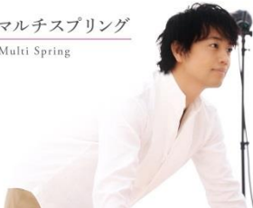
全方向マルチスプリング Multi Spring