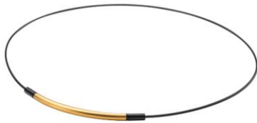
ゴールド/ブラック

軽量のワイヤー素材は、水に強く、 スポーツシーンのハードな使用にも 耐える高耐久素材。