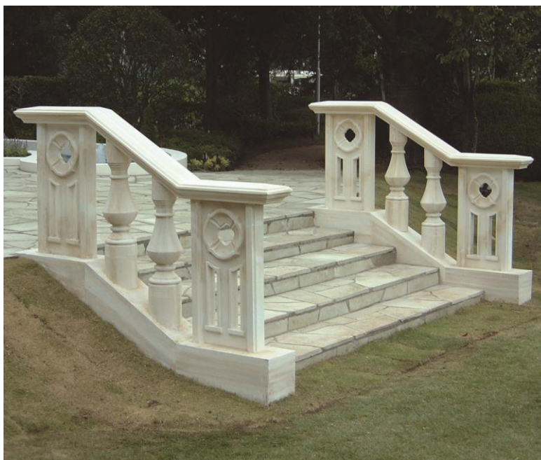
GRC-L使用部分： 階段手すり