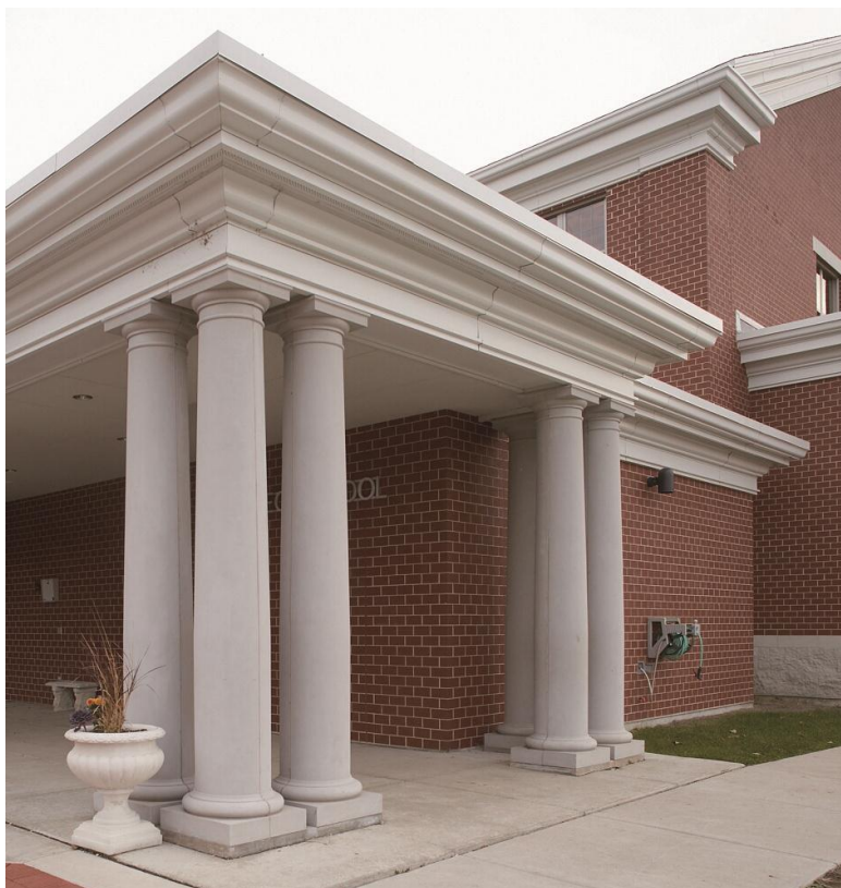
GRC-L使用部分： 円柱&屋根

内装一壁・柱・梁カバー・手すり・廻り縁・暖炉・壁面飾り・レリーフパネルなど 外装一壁・柱・梁カバー・手すり・ドア廻り・ディスプレイ・レリーフパネルなど