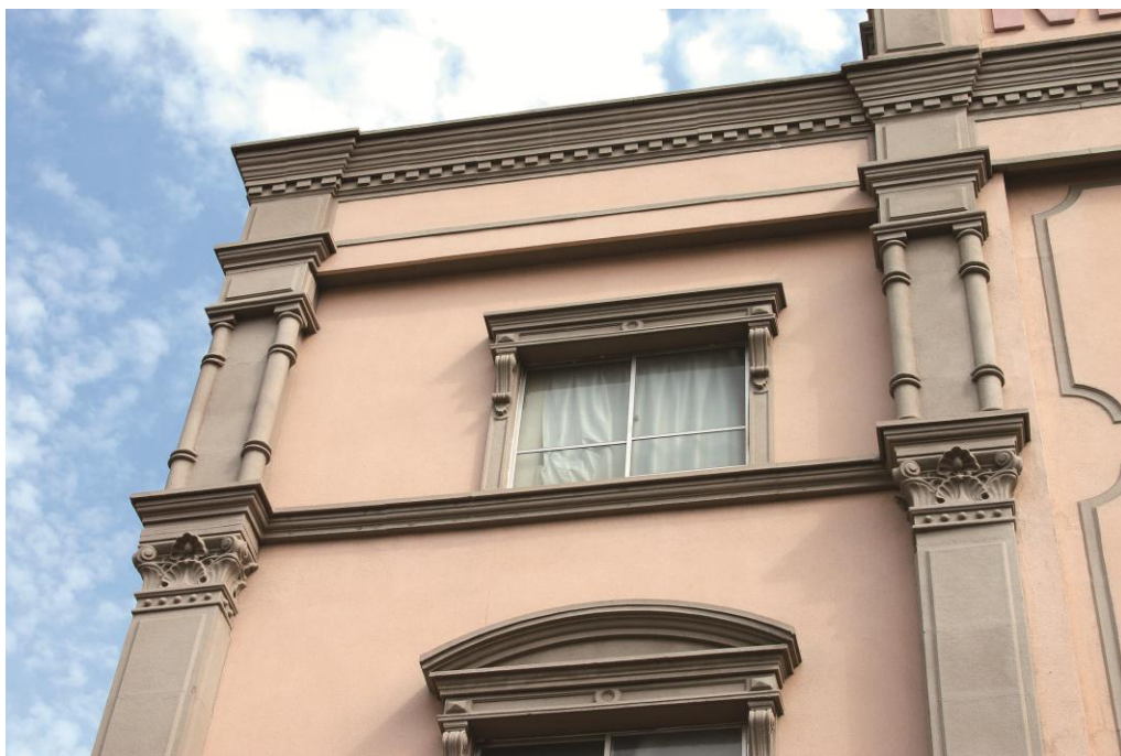
GRC-L使用部分: 付柱&廻り縁など

GRC-LとはGlass fiber Reinforced Cementの略であり、セメントまたはセメントモルタルをガラス繊維で補強した複合体の総称です。弊社は一般的なGRC製品よりさらに軽量化を図っているため、さらに「L」をつけています。従来のセメント製品では難しい薄い形状の製品加工が可能になりましたので、壁や柱、窓枠、ドア枠といったところにも細やかな表現を創りだすことができます。また、セメントにガラス繊維を混ぜ合わせることで大幅な軽量化と耐久性の強化を実現いたしました。