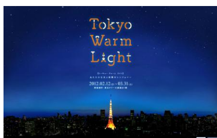
(スペシャルサイト)