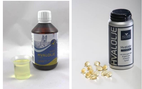
ノルウェーのペット用サプリメント ノルウェーのヒト用サプリメント

当社の親会社であり、ノルウェーで商業捕鯨を行う Myklebusut Hvalprodukter AS では、ペット用だけでなくヒト用のサプリメントも製造・販売しており、高い評価を得ています。形状は異なりますが、内用液は同等のものを使用しており、 ペットにもヒューマングレードのサプリメントを投与することが一般的です。 また、寒い環境のノルウェーでは一般家庭のペットだけでなく、「犬ぞりレースのアスリート犬」からも重宝されています。