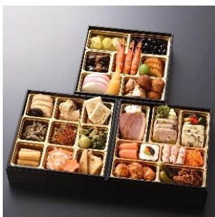
おせち 2019 銀座花蝶監修 和洋三段重 「花祥賀」全39品 12/30お届け