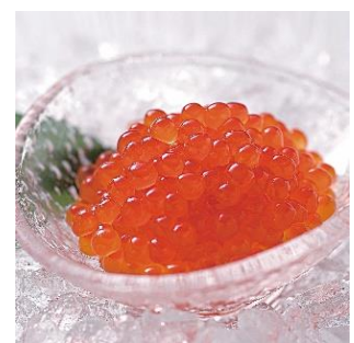
黒帯 いくら醤油漬け 500g 北海道産