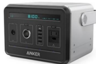
Anker PowerHouse (434Wh/120,600mAh ポータブル電源) 【静音インバーター/USB & AC & DC 出力対応/PowerIQ 搭載】