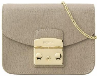
FURLA ショルダーバッグ 並行輸入品