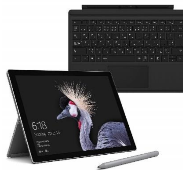
【Microsoft ストア限定】3点セット Surface Pro+ 専用 タイプ カバー + 専用 ペン