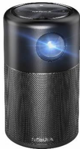
Anker Nebula Capsule(Android 搭載モバイルプロジェクター)