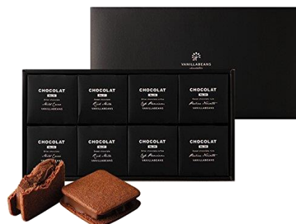
VANILLABEANS ショーコラ 8個入