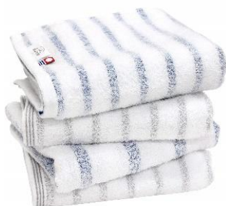
hiorie(ヒオリエ) 今治タオル 認定 mist ミスト フェイスタオル 4枚セット (グレー2枚+ブルー2枚)