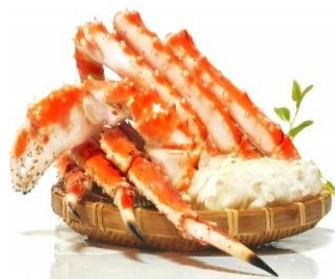
黒帯 タラバガニ ギフトパック (1kg:1kgx1 肩入)