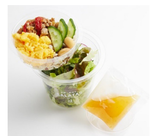
<「RF1」のパックサラダ (イメージ)>