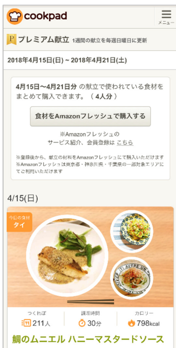
クックパッドのプレミアムサービス会員向け「プレミアム献立」ページ (イメージ)