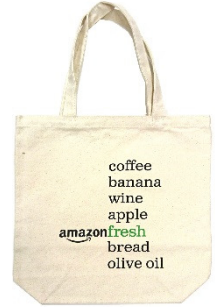
Amazon フレッシュのオリジナルトートバッグ