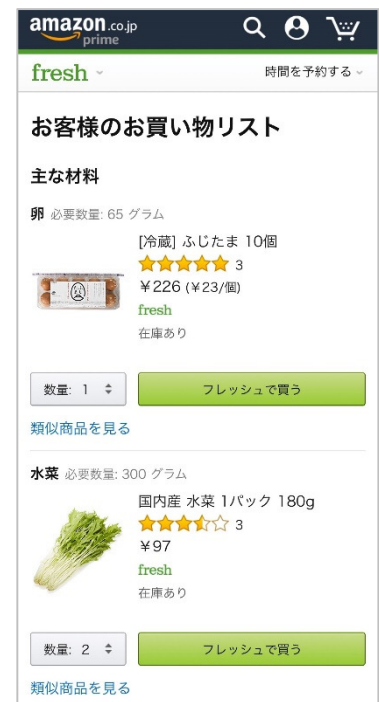
Amazon フレッシュ上の「お買い物リスト」 (イメージ)