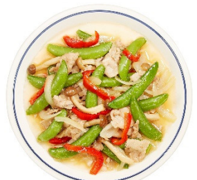
<ミールキット (イメージ)>

さらに、カット済みで洗わずにそのまま使える カットサラダ・カット野菜を30種類以上 取り揃えているほか、焼くだけで簡単に調理できる味付き肉や、フレーク状に凍結して使いたい量だけすぐに取り出して便利な「パラパラミンチ」など、“時短”に役立つ食材を拡充し、品揃え面における利便性もご提供します。