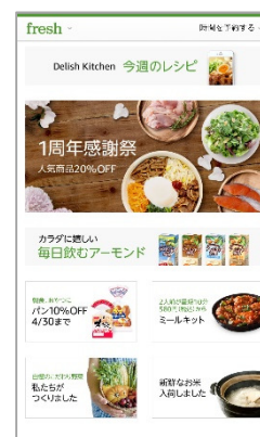
Amazon フレッシュ トップページ <モバイルアプリ>