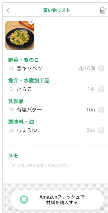
DELISH KITCHEN のモバイルアプリの「買い物リスト」 (イメージ)