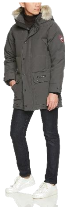
(カナダグース)CANADA GOOSE メンズ ファー付き フーデッド ダウンジャケット EMORY PARKA [並行輸入品]