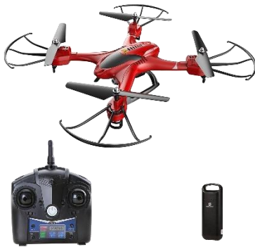
Holy Stone ドローン HD カメラ付き iPhone&Android 生中継可能 高度維持機能 【★平均 4.6(カスタマーレビュー 309 件)】