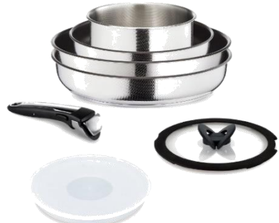
【Amazon.co.jp 限定】ティファール フライパン 鍋 7 点 セット IH 対応