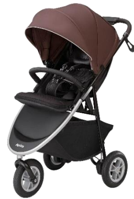
Aprica 3 輪ハイシートベビーカー Smooove 3 年保証登録可 【★平均 4.4(カスタマーレビュー 51 件)】