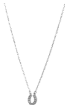
【スワロフスキー】SWAROVSKI ネックレス 【並行輸入】