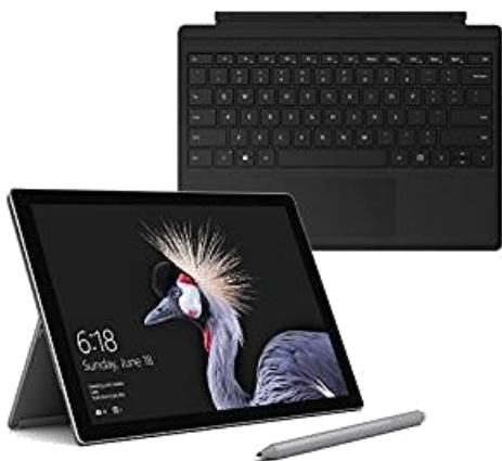
【Amazon.co.jp 限定】Surface Pro (i5 / 256GB / 8GB モデル) + 専用 タイプ カバー (ブラック) + 専用 ペン (プラチナ)