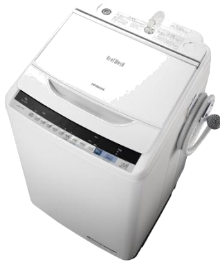
日立 全自動洗濯機 ビートウォッシュ 8kg ホワイト BW-V80B W