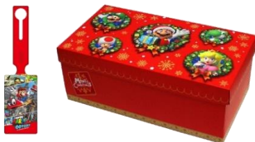
Nintendo Switch スーパーマリオ オデッセイセット+ 【Amazon.co.jp 限定】オリジナルラゲッジタグ+ ギフトラッピングキット (大) ボックス:マリオ