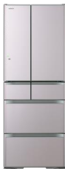
日立 真空チルド 冷蔵庫 プレミアム XG シリーズ 505L クリスタルシャンパン R-XG5100G XN