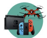
クリスマスギフトにも今年売れ筋商品