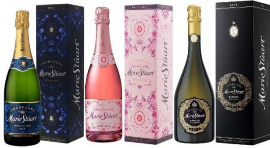
【セット買い】Amazon が直輸入 フランス女王の名を冠した熟成シャンパン 3 本セット 750mlx3