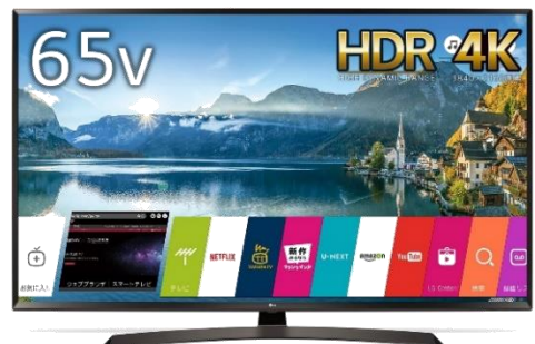
LG 65V 型 4K 液晶テレビ HDR 対応 IPS4K パネル スリムボディ Wi-Fi 内蔵 UJ630A シリーズ