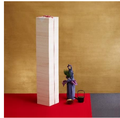
Amazon 限定 日本一背の高い「タワーおせち」 ※2017 年 11 月 1 日時点 タワーおせち事務局調べ