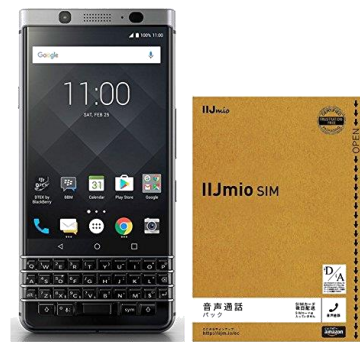
【日本正規代理店品】BlackBerry KEYone Black/Silver 32GB Android SIM フリー スマートフォン QWERTY キーボード& IJmio SIM カードウェルカムパックセット