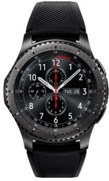
Samsung スマートウォッチ Galaxy Gear S3 Frontier iOS/Android 対応【Galaxy 純正 国内正規品】 【★平均 4.4(カスタマーレビュー 75 件)】