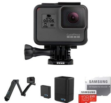
【国内正規品】GoPro ウェアラブルカメラ HERO5 Black + バッテリー + 3-Way + microSDXC カード 128GB セット