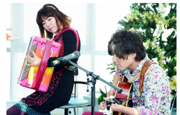
ランチタイムコンサートの様子