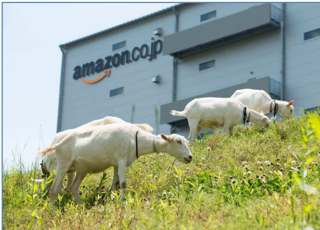
ベテランヤギ達は斜面をものともせず、さすがの仕事ぶりで大活躍

本取り組みは社員の働きやすい環境づくりの一環でもあり、自然環境に配慮した施設の整備と同時に、社員に「癒し」を提供することも目的としています。Amazon.co.jp では、今後も環境に配慮した活動を推進する予定です。また、より利便性の高いサービスの向上に尽力していくため、Amazon.co.jp の社員が働きやすい環境づくりに取り組んでまいります。