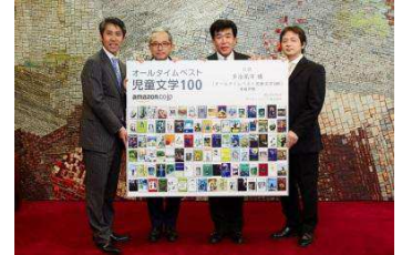
多治見市 目録贈呈式の様子

多治見市に寄贈した書籍は、2014 年 10 月 1 日より北栄小学校図書室を皮切りに、市内 21 小中学校の図書室を巡回し、約 3 年かけて展示・貸出を行っています。