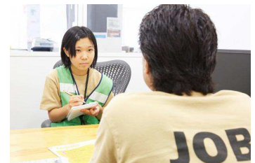
多治見 FC での「ジョブシャドウ」の様子

実際に生徒 1 名が Amazon の社員 1 名に数時間同行し、各職場の仕組みの違いやスタッフの役割、そして Amazon が展開しているグローバルビジネスを肌で体験しました。