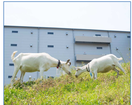
新人ガクト君(右)に教える最年長シン君(左) 風通しのよい環境で仕事に励んでいる