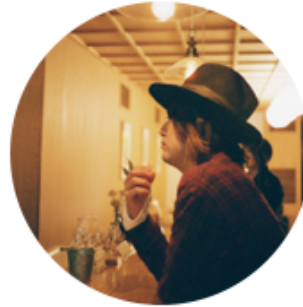
山下穂尊（いきものがかり）