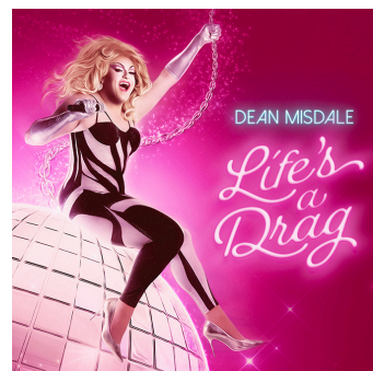
© Dean Misdale - Life's A Drag

2022年度の『FRINGE・ワールド・フェスティバル』で「最優秀キャバレー&バラエティ・ショー賞」を受賞した世界的に有名なドラッグ・クイーン、ディーン・ミスデイルが数々の受賞歴を誇る『ライズ・ア・ドラッグ』の最新作で帰ってきます。このキャバレー・ショーでは、ディーンが華やかな衣装と「パース」で一番高いヒールで登場し、ライブバンドの演奏をバックにお気に入りの曲をパワフルに歌います。