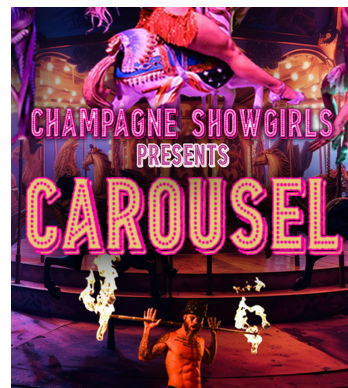
© Carousel - Presented By Champagne Showgirls

「X Awards 2020」でオーストラリア・ベスト・バーレスク・プロダクション賞を受賞したパフォーマンス集団「ショーガールズ」のキャバレー&バラエティショー。美しく不思議な生き物のコレクター「ニックス」が支配する魅惑的な場所「カルーセル」を舞台に、バーレスク、キャバレー、サーカスなど、数々の遊び心あるパフォーマンスで観客を幻想と欲望の世界へ誘います。