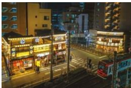
「東京大塚のれん街」