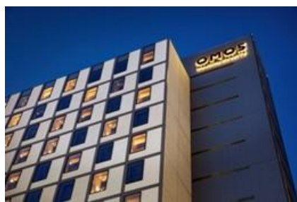
「星野リゾート OMO5 東京大塚」