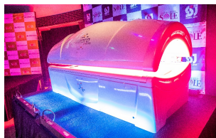
コラーゲンマシン