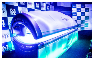
タンニングマシン