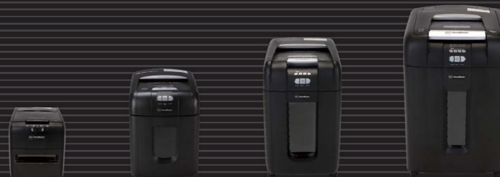
オートフィード シュレッダ 60AFX