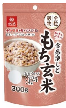
もちりぷちっと 食感楽しむもち玄米