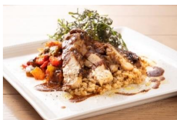
「岩手県産いわい鶏のグリルとキノコのもち麦リゾット」

「岩手県産いわい鶏のグリルとキノコのもち麦リゾット」を1日限定10食、ランチメニューでは「HATAKEの野菜スペシャルランチセット」に日替わりの「もち麦リゾット」を1日限定20食提供。該当メニューを頼んだお客様に、はくばくの調理済みですぐに使える商品『あとのせもち麦』1袋をプレゼントいたします。