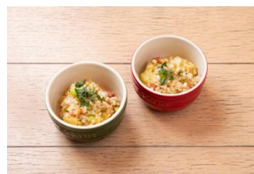
「HATAKEの野菜スペシャルランチセット」

※コラボについてのリリースはこちら： https://www.hakubaku.co.jp/news/450/