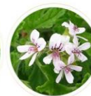
ニオイテンジクアオイ