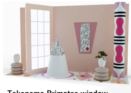
Tokonoma Primates window