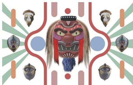
Yokai Primates window

Elena Salmistraro ミラノを拠点に活動。細部へのこだわり、かたちの調和と詩的な表現で、アートとデザインを融合するスタイルが特徴的。表現方法の探求、人々の感情に訴えかける作品の数々は、国際的な展示会に多く出展され、2017年にはミラノサローネ・アワードの最高賞を受賞。同年からイタリア外務省のイタリアデザインアンバサダーとして活動。