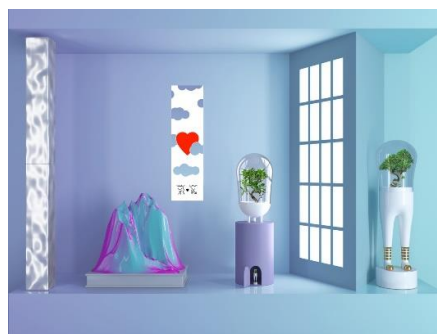
Tokonoma Domsai window