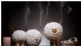
DESIGNER:Haas Brothers + Elad Yifrach BRAND :L'Objet CURATOR: Elad Yifrach PLACE : 本館2階

空想のモンスターや宇宙人をモチーフにしたユニークなインテリアコレクションや、デコラティブな植物インсталレーション、異国の地の24時間の移り変わりを投影し続ける窓、デニムが発する音を聴く体験などバラエティに富んだ作品をお楽しみいただけます。