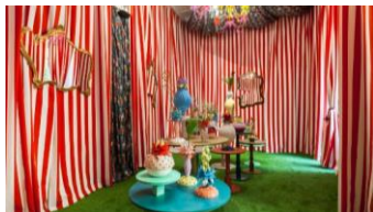
DESIGNER:Paula Cademartori BRAND :Bitossi Home & Funky Table PLACE : 本館3階