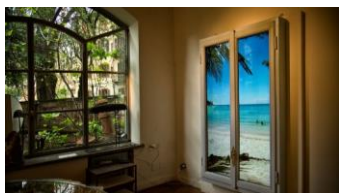
DESIGNER:Anotherview Collective (Marco Tabasso, Tatiana Uzlova, Robert Andriessen) PLACE : 本館7階