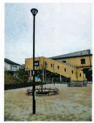
●防災・環境コーナー