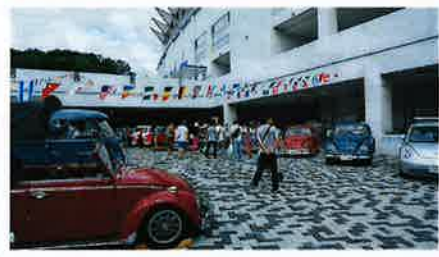
●カーショーエリア