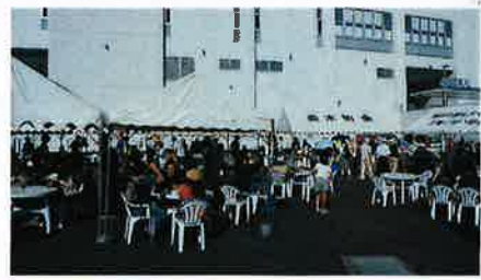
●町内会・フードエリア