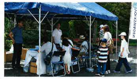
●ボクシングエリア