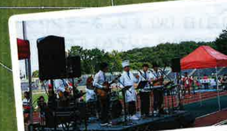
まほろ座ライブ 11:30 - 13:35