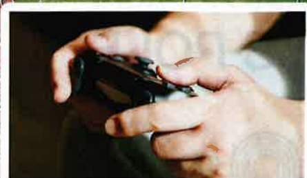
e-sports体験 10:00 - 16:00