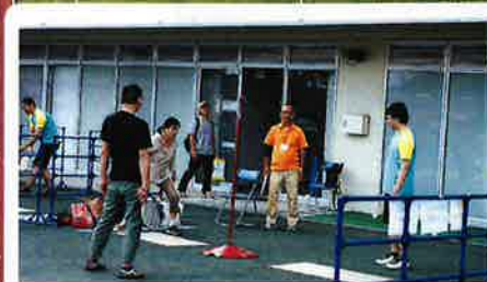
スピードボール体験 10:00 - 16:00