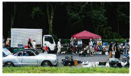
●フリーマーケット