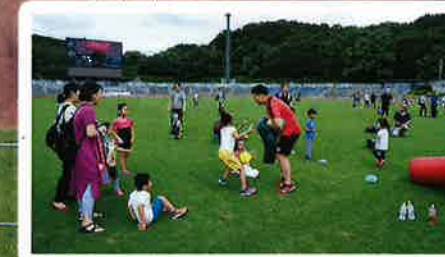
キャノンイーグルスラグビー教室 10:00 - 12:00