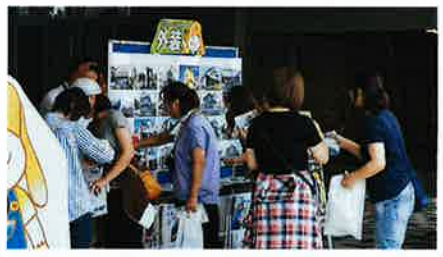
●スポンサーブース