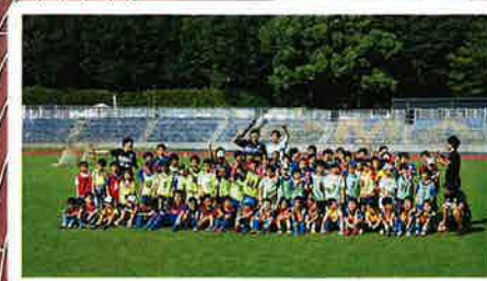
FC町田ゼルビアサッカー教室 14:00 - 16:00