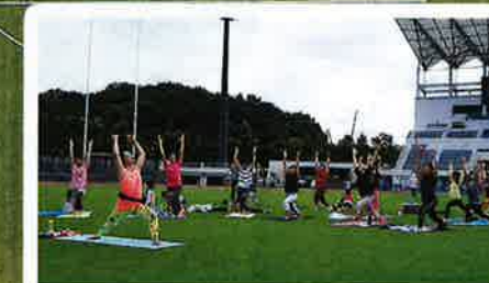
ピッチ de ヨガ 15:00 - 16:00