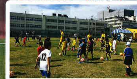
ベスコドーラフットサル教室 10:00 - 12:00