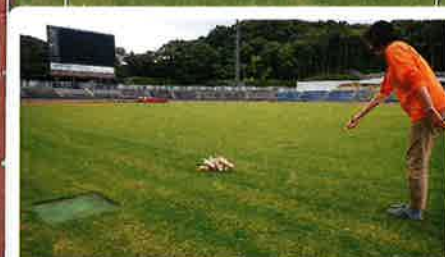
モルック体験 10:00 - 16:00