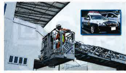
●はしご車/白バイ/パトカー乗車体験