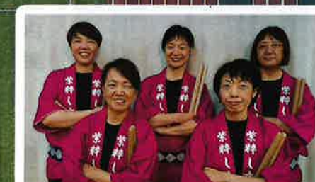
和太鼓 (紫粋(しすい)) 10:00 - 10:30