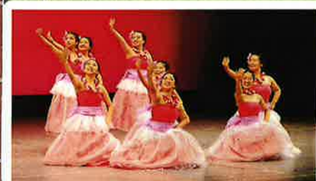
町田工業高校フラダンス 14:00 - 14:30