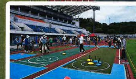
ユニカー体験 10:00 - 16:00