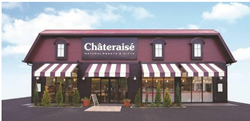
シャトレーゼ店舗イメージ

フェア開催中に500円以上お買い上げのお客様に、もれなくシュークリーム2個(ダブルシュークリーム1個、ピュアメルテ1個)をプレゼント！