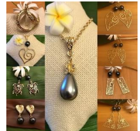
Milimili ハワイアンアクセサリー ハワイをイメージした オリジナルのハンドメイド アクセサリーを販売。