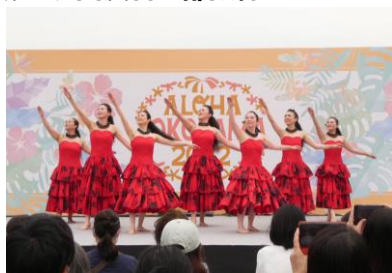
▲カ・レオ・オ・ラカ・イ・イーパナ ～カ・パー・フラ・オ・カウルレファ