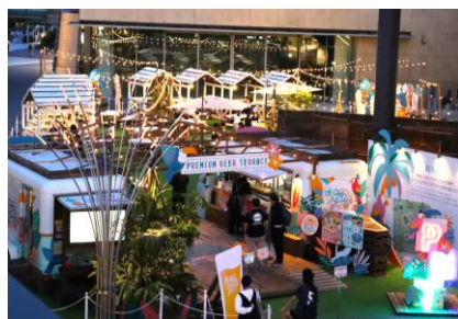
▲プレミアムビアテラス イメージ