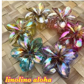
linolino aloha ハワイアン雑貨 ハワイアンクラフト商材や 懐かしくホットできるハワイアン 雑貨を豊富に揃えています。