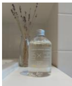
※賞品イメージ抜粋