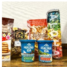
ハワイアンセレクトショップ ダブルレインボー ポップコーン専門店 ハワイで人気のフードを 集めて皆さまにお届けします。