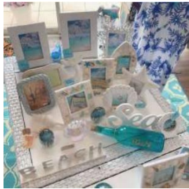
海雑貨&BAR Aperitivo ハワイアン雑貨など 海に関する雑貨や食器類、 リゾートに似合うオリジナル ワンピースなどを販売。