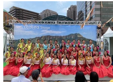
▲カフラオラウレア