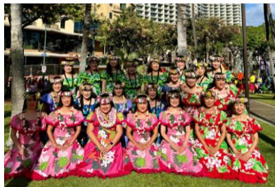
▲フラハーラウオマカナニ