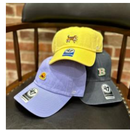
フォーティーセブン オリジナルキャップ ハワイモチーフの ワッペンを選んで作る オリジナルキャップを販売。