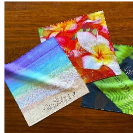
LINO MAKANI HAWAII ハワイアン雑貨 写真家 高山 求が撮影した、 ハワイの島々の写真をプリントした オリジナルグッズなどを販売。