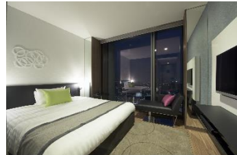
スーパーリアダブル