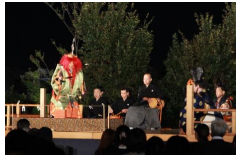
「二子玉川ライズ薪能」の様子（2022年撮影）